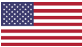
Département d'État américain Bureau de surveillance et de lutte contre la traite des personnes (J/TIP)

Fondasyon Limyè Lavi (FLL) est une fondation haïtienne établie en 1992. FLL intervient dans les domaines suivants: protection de l'enfance, éducation formelle et alternative, plaidoyer et renforcement des capacités organisationnelles. Elle travaille principalement dans les communautés rurales les plus reculées et marginalisées du pays pour lutter contre la servitude domestique des enfants connu sous le nom restavèk . L'une des priorités de la Fondation est d'aider les pauvres à devenir des "communautés modèles" où les familles, les responsables communautaires et les membres qui y vivent élaborent des stratégies pour améliorer leurs conditions socio-économiques et protéger et défendre les droits de l'enfant.