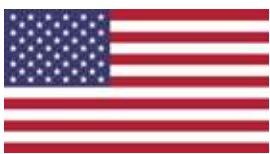
Département d'État américain Bureau de surveillance et de lutte contre la traite des personnes (J/TIP)

Fondasyon Limyè Lavi (FLL) est une fondation haïtienne établie en 1992. FLL intervient dans les domaines suivants: protection de l'enfance, éducation formelle et alternative, plaidoyer et renforcement des capacités organisationnelles. Elle travaille principalement dans les communautés rurales les plus reculées et marginalisées du pays pour lutter contre la servitude domestique des enfants connu sous le nom restavèk . L'une des priorités de la Fondation est d'aider les pauvres à devenir des "communautés modèles" où les familles, les responsables communautaires et les membres qui y vivent élaborent des stratégies pour améliorer leurs conditions socio-économiques et protéger et défendre les droits de l'enfant.